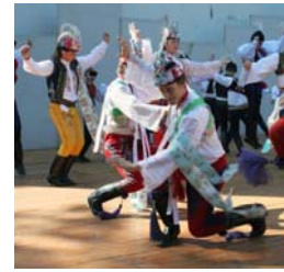
Straznice 国際フォークロア・フェスティバル